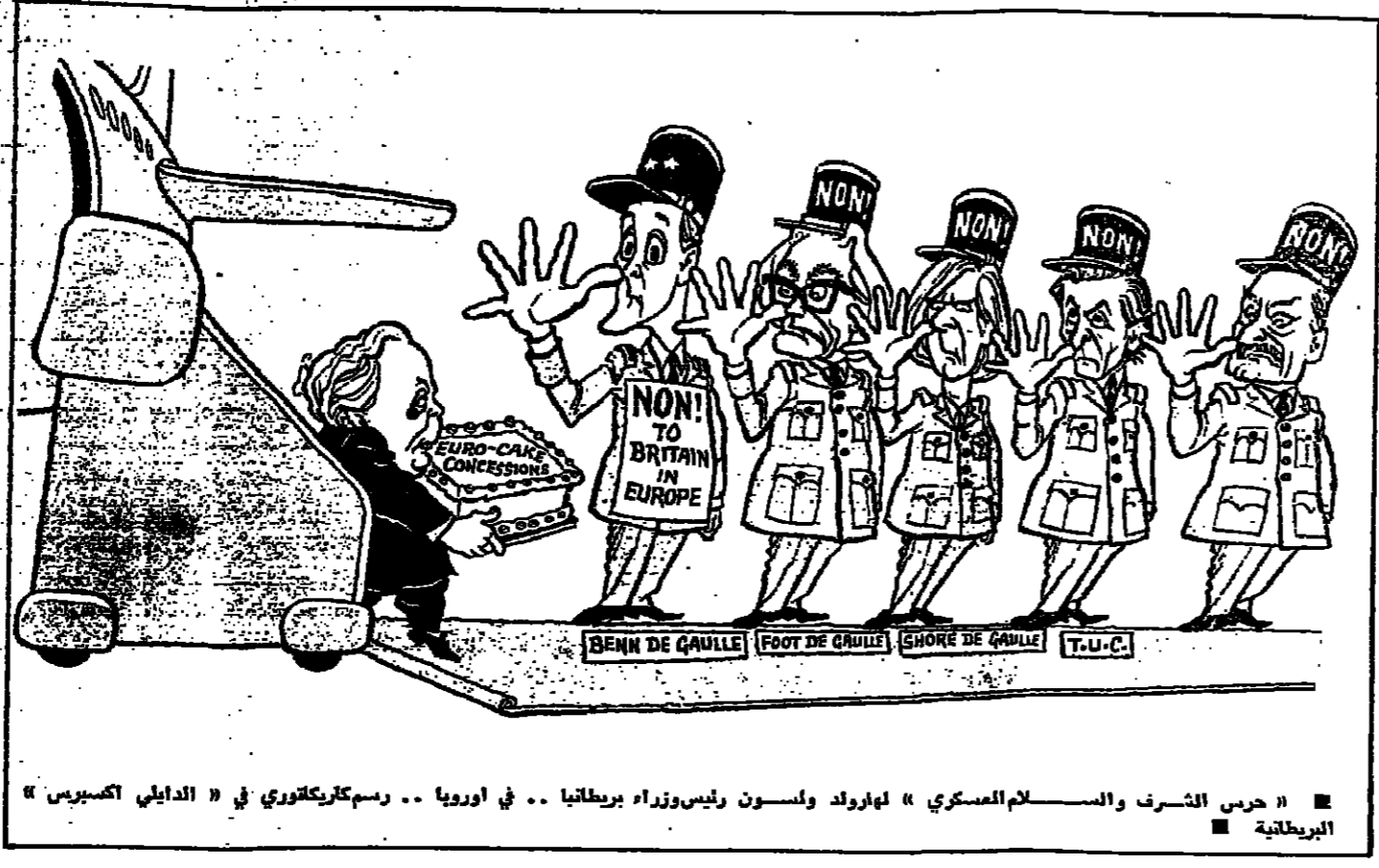
حرس الشرف والاسلام العسكري « لهارولد ولسون رئيس وزراء بريطانيا .. في اورويبا .. رسم كاريكاتوري في « الدابلي اكسبريس » البريطانية